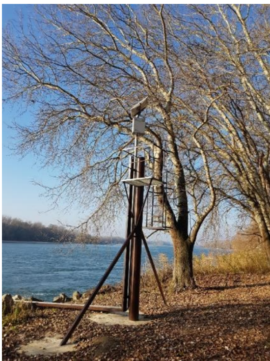
Existujúca vodomerná stanica VV, š.p. v Čičove