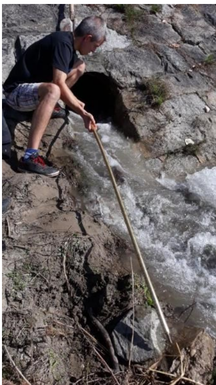
Šachta pri areáli VÚVH s napojením na Dunaj