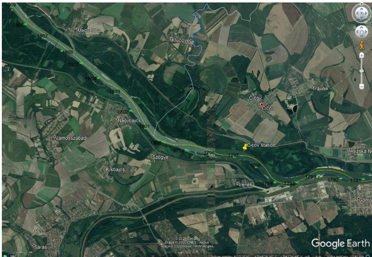
Mapa s lokalitou umiestnenia monitorovacej stanice Čičov